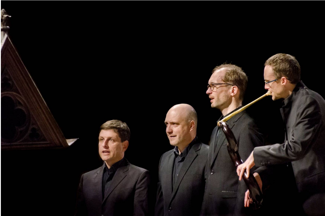
Les Meslanges à St Germain-des-Prés, 10 mai 2016.