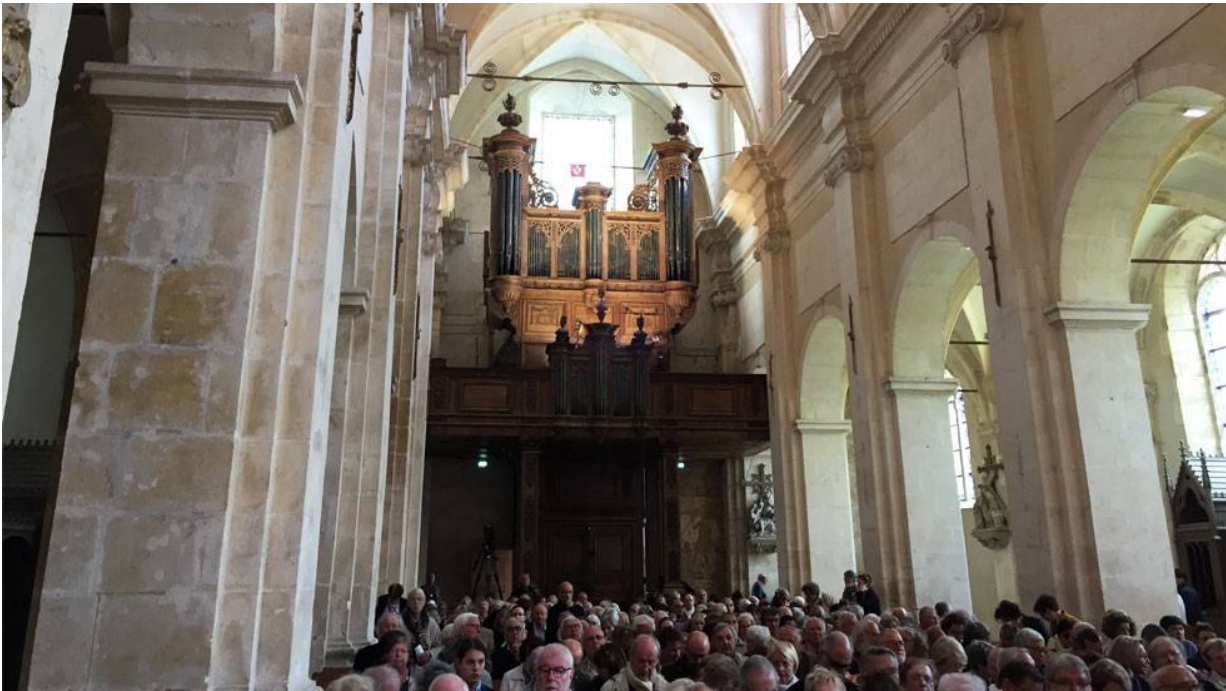
Orgue de l'Abbaye de Saint-Michel-en-Thiérache